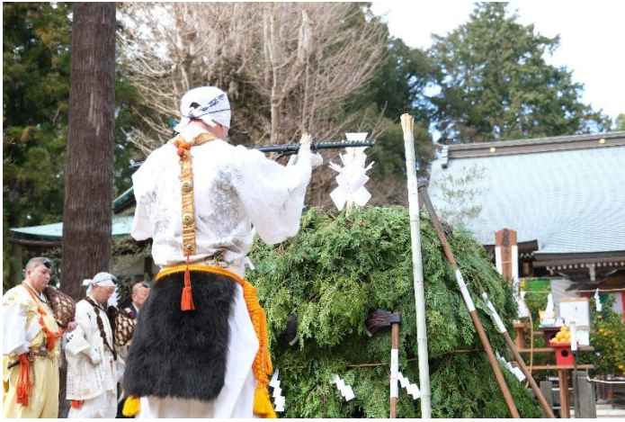
正月大護摩法 (一月)